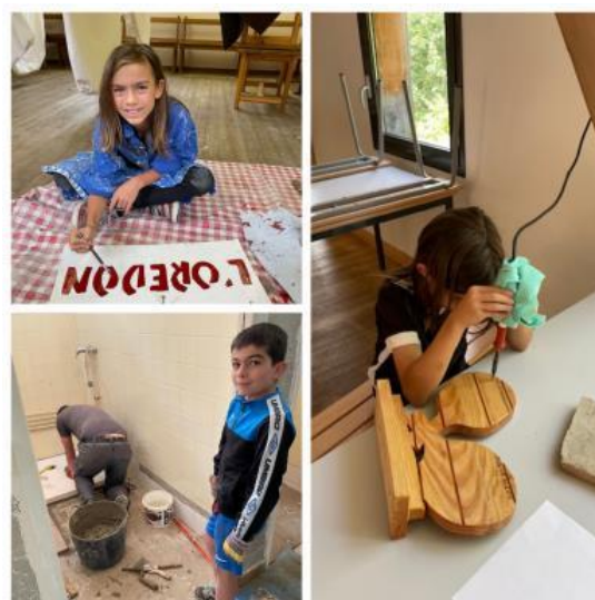
La Jeune relève...