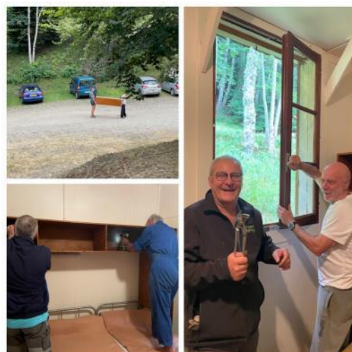
Les équipes volantes, en plein vol