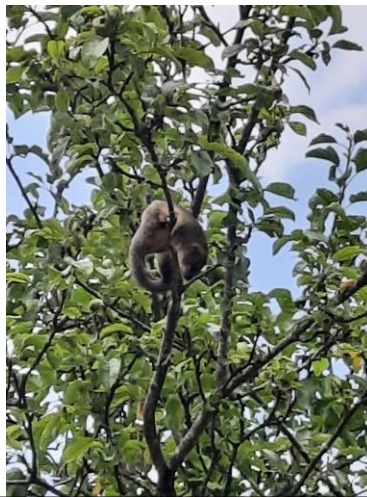
Un occupant ...endormi