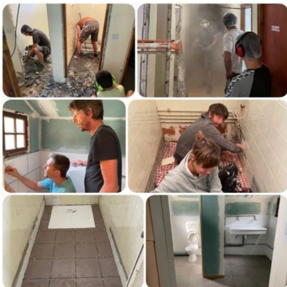
Rénovation sanitaires Orédon, Barroude