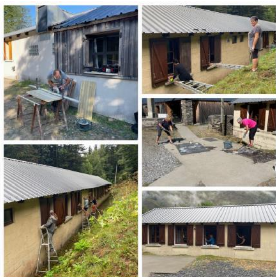
Lessivage et peinture ...acrobatique