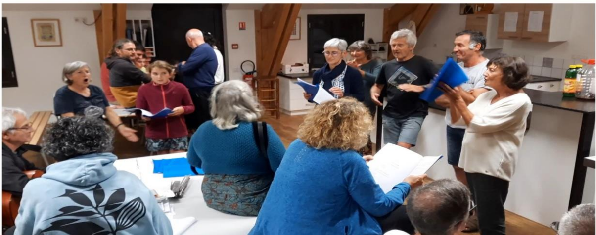
Et toujours en chansons