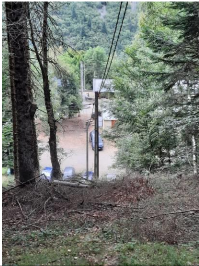
Elagage et débroussaillage